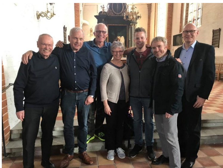
Styregruppen for Mahabba.dk (Se navnene på hjemmesiden)

https://www.facebook.com/groups/208263606773908/?ref=bookmarks